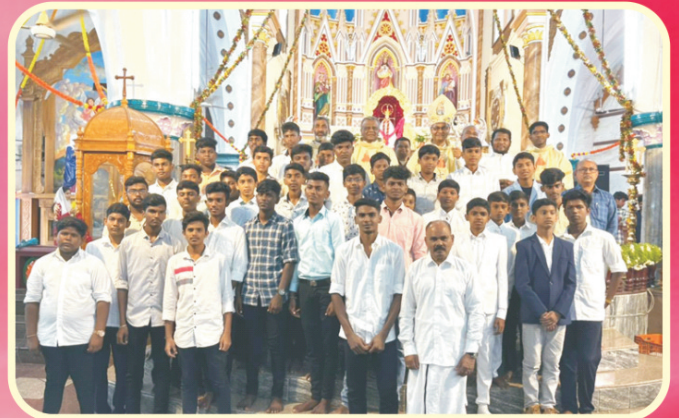
Blessing of the New Block at St. Joseph Mat. Hr. Sec. School, Mangalagiri (11.08.2022)