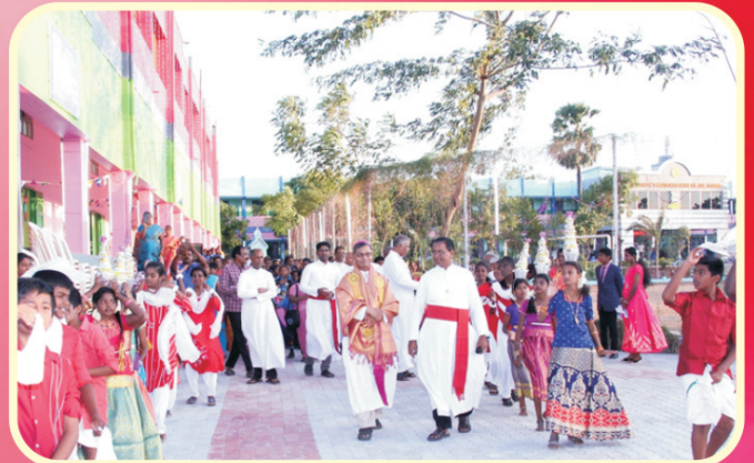
Blessing of the Church at Sirappur, Kozhunthattu (10.08.2022)