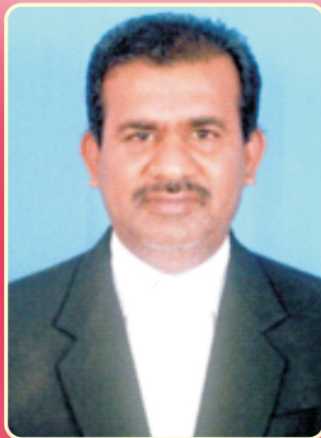
Fr. Joseph Stalin