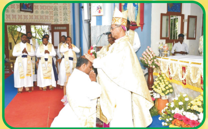
Diocesan Centenary Celebration - Inaugural Mass (19.06.2022)