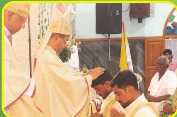
Priests' Reunion (19.04.2022 & 20.04.2022)