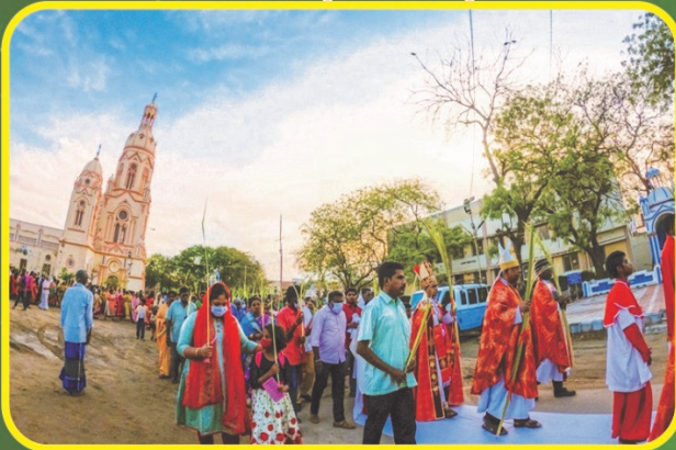
Chrism Mass at Sacred Hearts' Cathedral (12.04.2022)