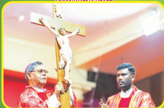
Easter Vigil Mass at Sacred Hearts' Cathedral, Tuticorin (16.04.2022)