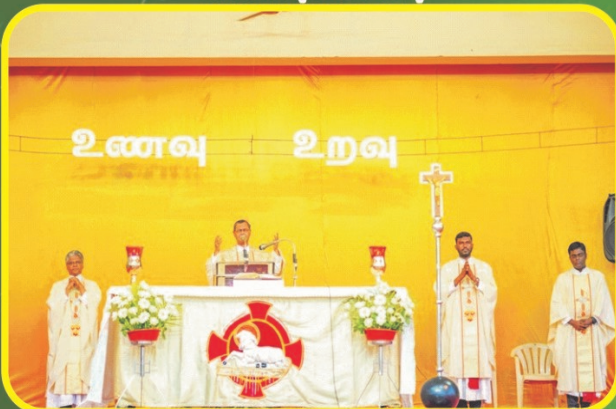
Good Friday at Sacred Hearts' Cathedral, Tuticorin (15.04.2022)