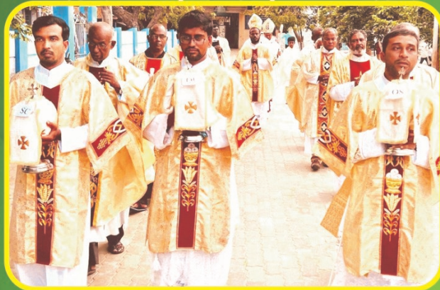
Maundy Thursday at Sacred Hearts' Cathedral, Tuticorin (14.04.2022)