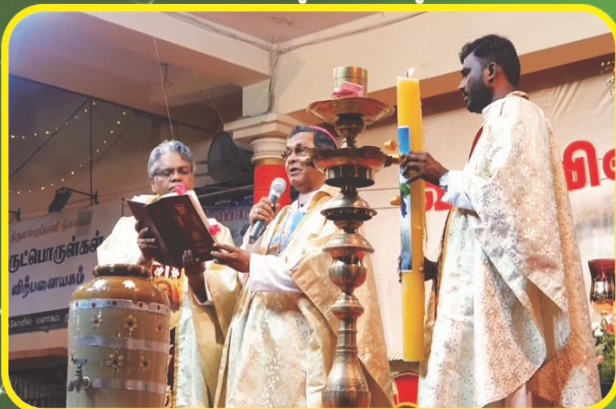
Ordination of 2 OMD Fathers at Kombuthurai (18.04.2022)