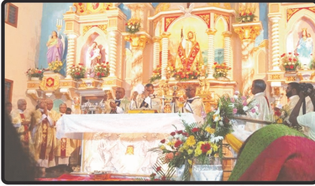
Mass at Pazhayakayal (18.12.2021)