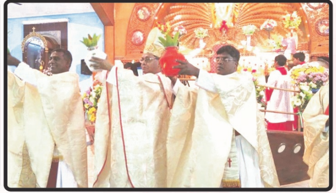
Christmas Celebration at Bishop's House (23.12.2021)