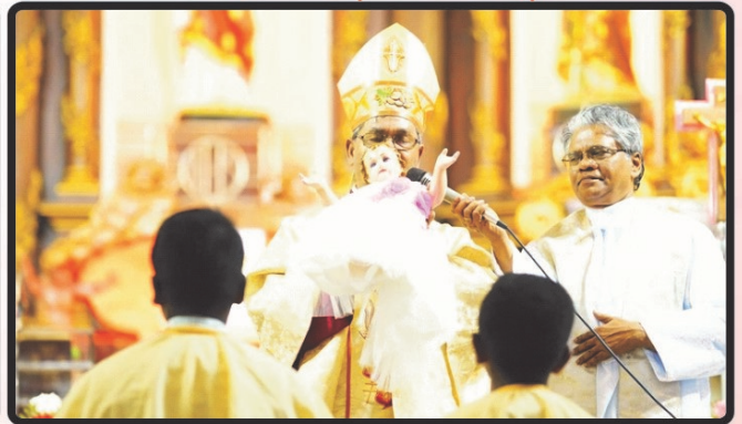
Golden and Silver Jubilee Celebration of Couples at Vallioor (26.12.2021)