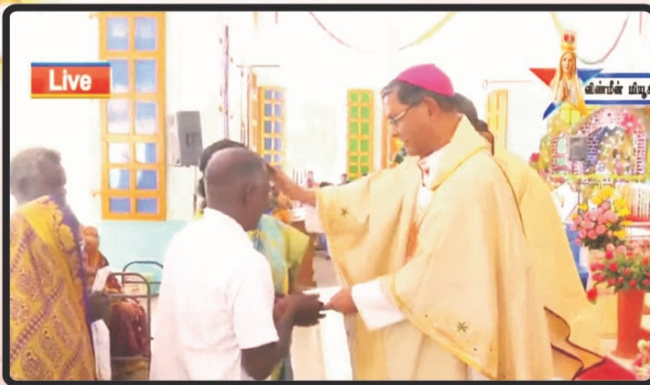
New Year Mass at Sacred Hearts Cathedral, Tuticorin (01.01.2022)