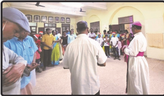
Christmas Mass at Sacred Hearts Cathedral, Tuticorin (24.12.2021)