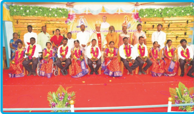
Prison Ministry Christmas celebration at Tuticorin District Jail, Peroorani (17.12.2021)