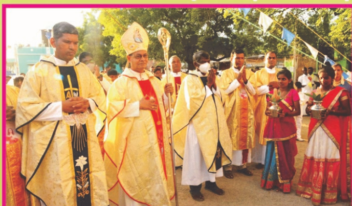
Pastoral Visit at Eral, St. Joseph (09 & 10.10.2021)