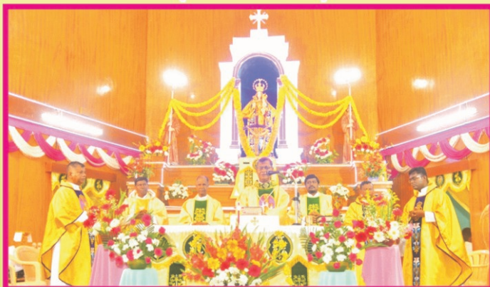
Blessing of the Bell Tower and Mass at Thisayanvilai (05.10.2021)