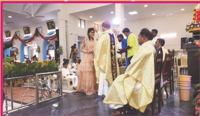
Synod Inaugural Mass at Sacred Hearts' Cathedral, Tuticorin(18.10.2021)