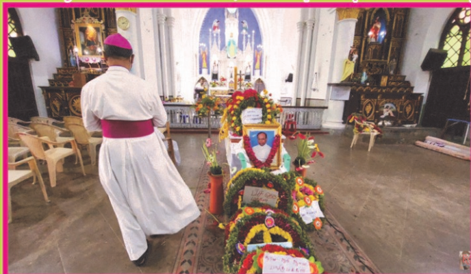
Feast Mass at Fatimanagar (13.10.2021)