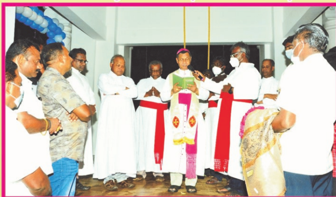
Feast Mass at Mannarpuram (07.10.2021)