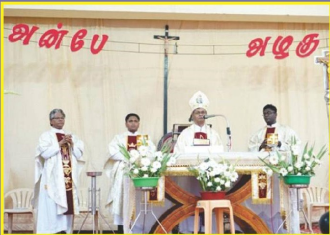
Easter Vigil at Sacred Hearts' Cathedral, Tuticorin (03.04.2021)