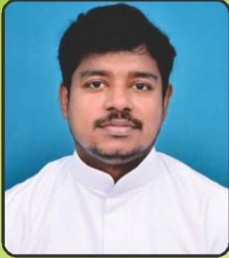
Dn. Savariraj F.C.