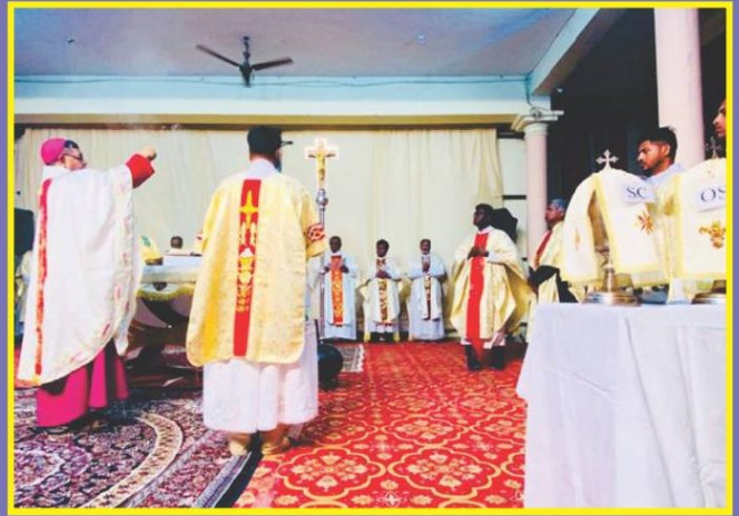
Maundy Thursday & Good Friday at Sacred Hearts' Cathedral, Tuticorin (01,02.04.2021)