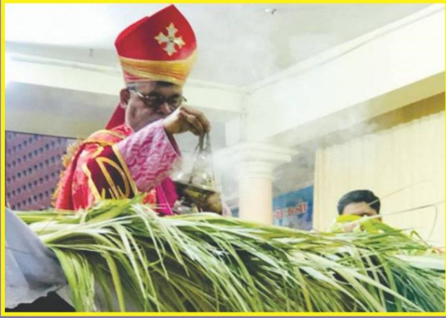
Palm Sunday service at Sacred Hearts' Cathedral, Tuticorin (28.03.2021)