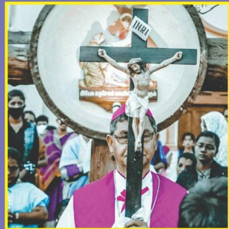
Pastoral Visit & Confirmation at Chinthamani Parish (05.04.2021)