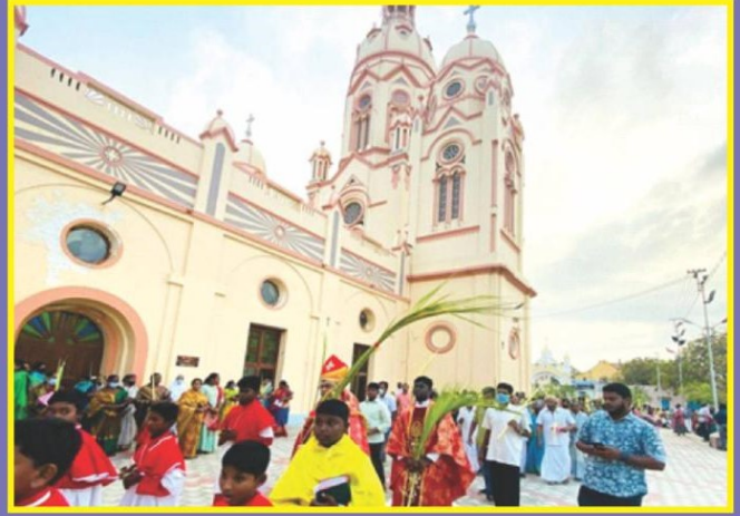
Chrism Mass at Sacred Hearts' Cathedral (30.03.2021)