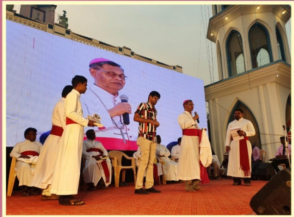
Christmas Celebration at Bishop's House - 21.12.2020