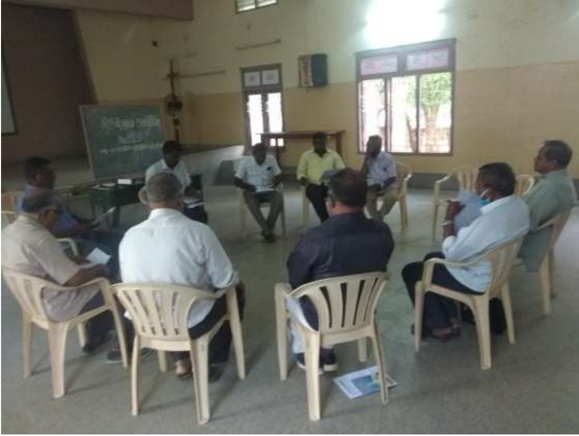
சமய நல்லிணக்க விழா, பெரிய பள்ளிவாசல், தூத்துக்குடி