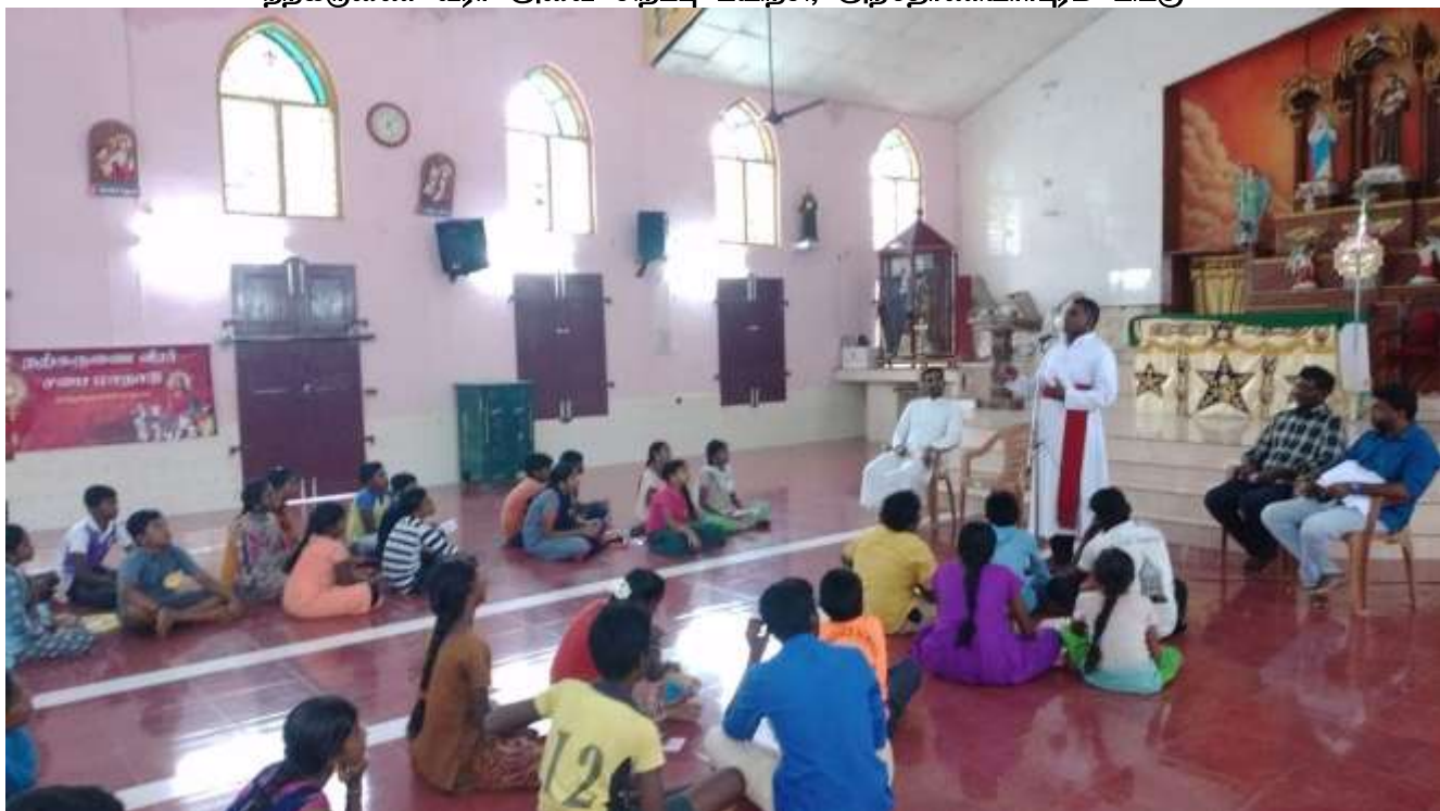
கிறிஸ்தவ ஒன்றிப்பு செயற்குழு கூட்டம், நற்செய்தி நடுவம்