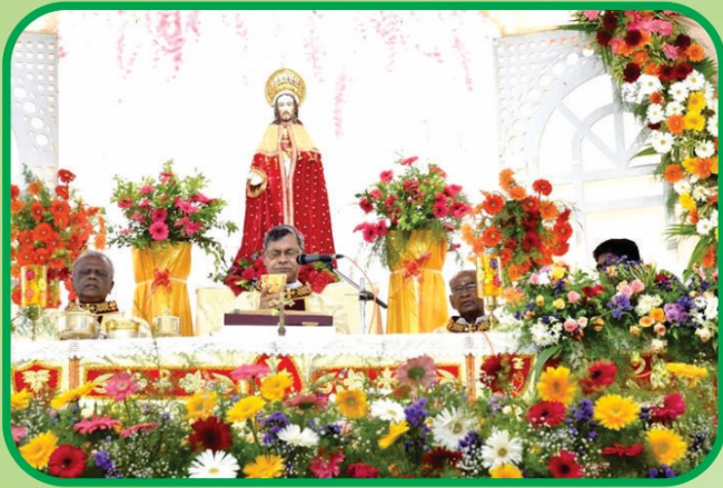
Feast Mass at Little Flower Seminary (02.10.2023)