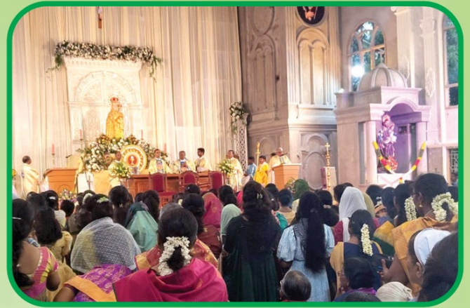
Feast Mass at Therespuram (08.10.2023)