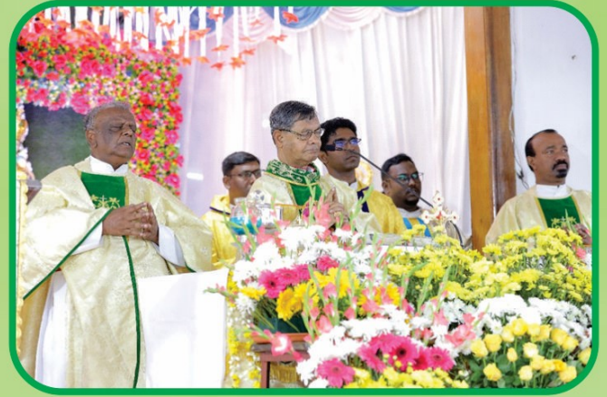
Blessing of the New Church at State Bank Colony (01.10.2023)