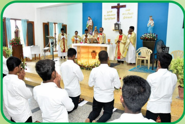
Announcement of the New Parish, Blessing of the Presbytery & Feast Mass at Meenavankulam (08.10.2023)