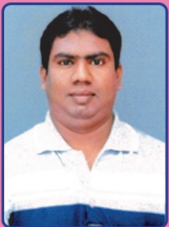
Fr. Jesu Nazarene S.