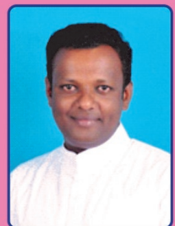
Fr. Infant E.